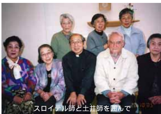
スロイテル師と土井師を囲んで