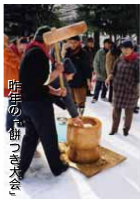
昨年の「餅つき大会」

1月3日(火) 12時から・五橋公園で「餅つき」をします。カラオケ大会もあります。