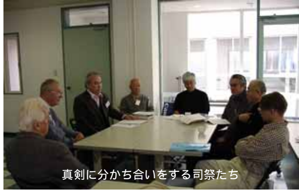
真剣に分かち合いをする司祭たち

ある。聖霊によって私たちをまします御子に似たものとしてくださる。そして、キリストのからだをいただくことは、単に個人の聖化だけでなく、「キリストのからだ」(神秘体「教会共同体」となるためでもある。従って、キリストのからだ(聖体)は、教会を作るものである。パンとぶどう酒をキリスト