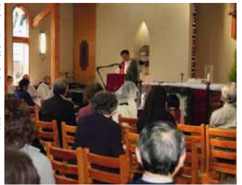
降節の黙想会をお願いいたしました。

神父様を追いかけるように6月には研修旅行で気仙沼教会を訪問しました。そして今回、ユン神父様に待