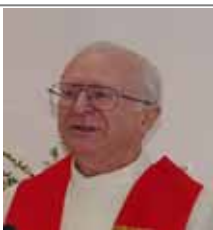
ベック外国宣教会(は、日本における50年の宣教活動を終

ミサが大切だと言っておきながら司祭不在でミサが出来ない教会がある。カトリックの文化は、どちらかといえばヨーロッパの古い文化に属してい