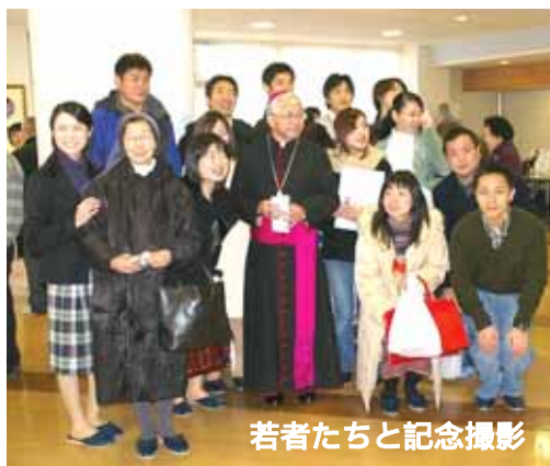
若者たちと記念撮影