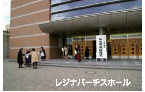
レジナパークスホール