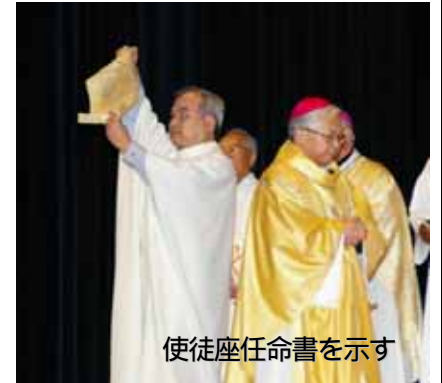
使徒座任命書を示す