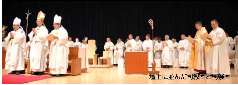
壇上に並んだ司教団と司祭団