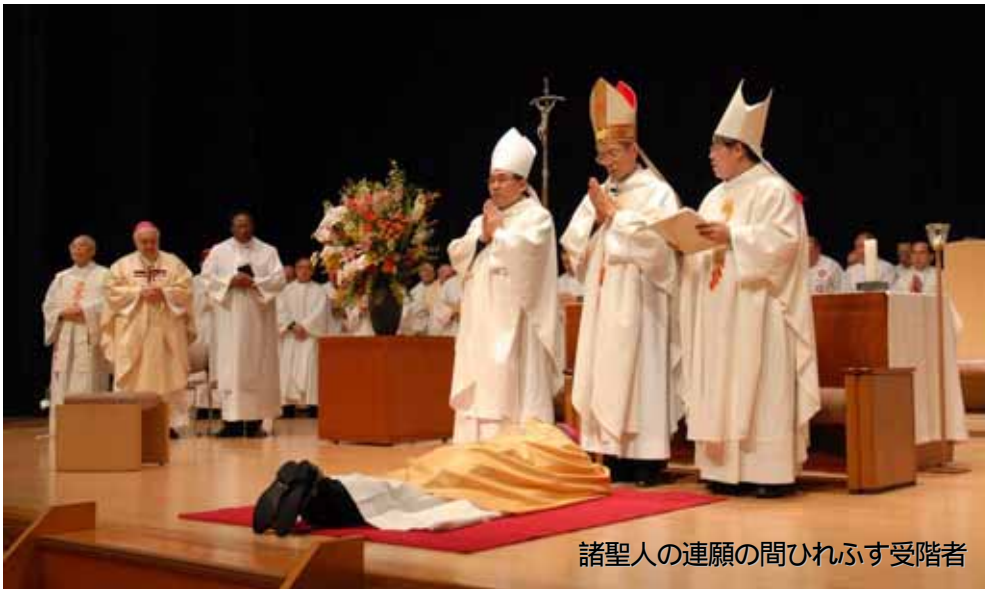
諸聖人の連願の間ひれふす受階者