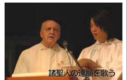
諸聖人の連願を歌う