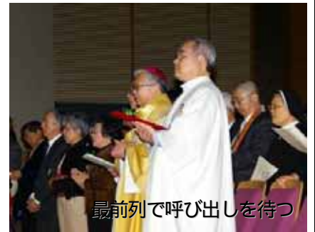
最前列で呼び出しを待つ