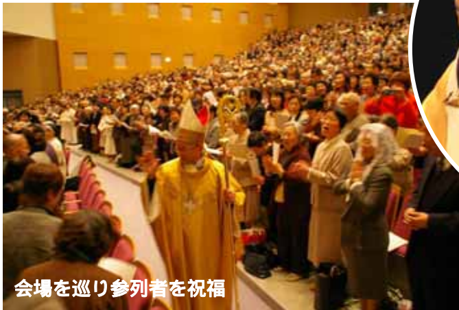
会場を巡り参列者を祝福