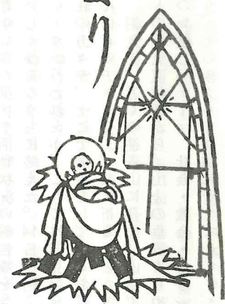
(第 26 号) 昭和54年12月1日