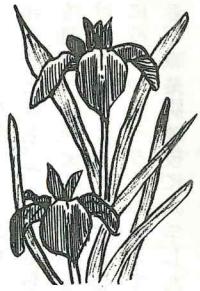
(第 55 号) 昭和 57 年 5 月 1 日

春は、ものみなが新しくよみがえる季節。わが仙台教区も復活祭をお祝いして、各地区や各小教区教会は新しい教会活動を開始しました。信者の一人ひとりにとっては、救いに至るための福音を實行する信仰生活を新たにすることです。同時に、教会とすべての信者に与えられた福音宣教の使徒職のために働くことでもあります。さる3月、司教協議会の宣教司牧司教委員会から、「洗礼のめぐみを一人でも多くの友に伝えよう」というパンフレットが発表され全国の教会に送られました。その趣旨と内容は特に新しいものではありません。教会が福音宣教のために働くことは当然のことです。日本の教会も私たちすべての信者もそのために働いてきたのは事実です。ただ今回のよびかけは、その活動をさらに活発に、そして洗礼にまでみちびいてキリストの福音にしたがう信者を一人でも多くふやすという、