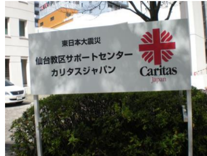
↑ 仙台カテドラルにある仙台サポートセンター本部

皆様にお伝えしなければならないことが山積みなのですが、力不足です。今回は、全国の教会が仙台教区をどのように支援して下さっているかについてご報告します。