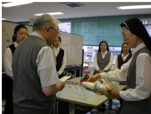
←現地へボランティアとして来て下さった多くの修道会のシスターたちがサポートセンター訪問してくれています

3月16日、サポートセンターが立ち上がった直後から、自発的にボランティアに参加して下さったり、サポートセンターや仙台教区内の小教区や修道会、カトリック事業体への様々な緊急支援が行われました。本当に感謝しています。後になって、様々な支援が仙台教区内の教会や被災地に届けられていたことを知ることができました。一人ひとりの皆様に直接にお礼を届ける事ができません。この場を借りて御礼申し上げます。