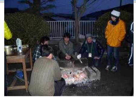
↑ 初期の釜石ベースのボランティア