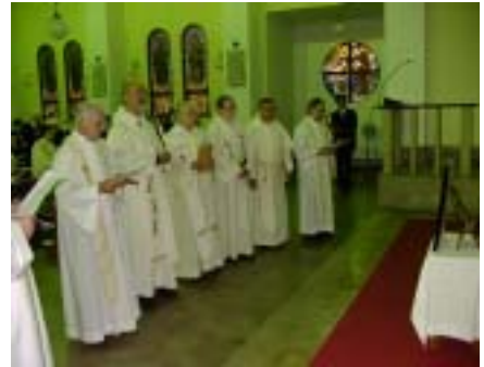
ミサの後、遺影を囲み「サルベリジナ」を歌うドミニコ会司祭たち